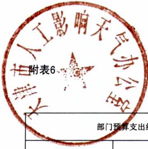
一般公共预算基本支出情况表