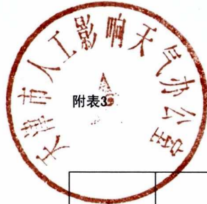
部门支出总体情况表